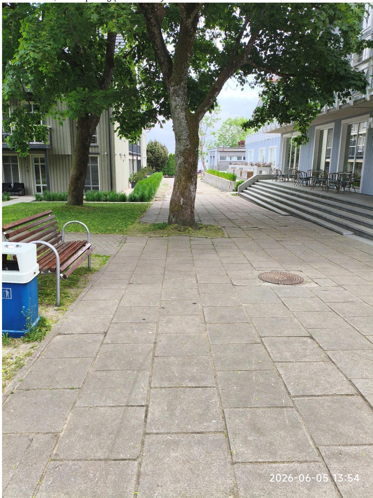
Pav. Nr. 3, Esama pėsčiųjų tako situacija